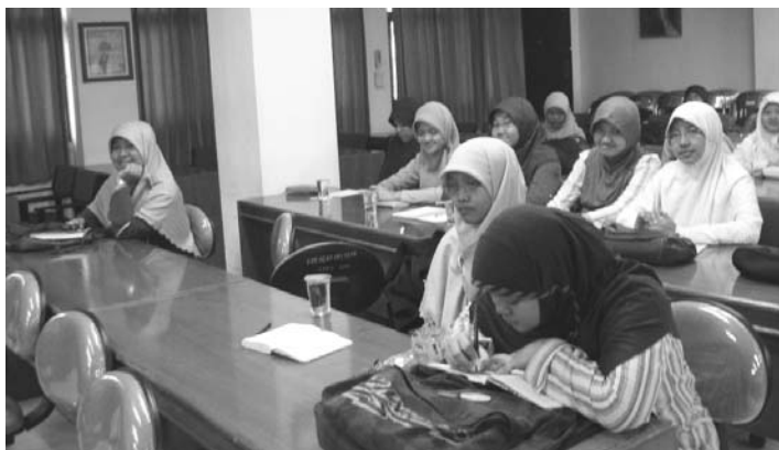
Suasana Pelatihan Dakwah Fardhiyah di Ruang Adi Sukadana

Bekerjasama dengan Sie Kerohanian Islam (SKI) Fakultas Ilmu Budaya (FIB), Fakultas Kedokteran Hewan (FKH), dan Unit Kegiatan Mahasiswa Kerohanian Islam (UKMKI) Unair, SKI FISIP pada Rabu, 22 Juli lalu mengadakan Pelatihan Dakwah Fardhiyah (PDF). Pelatihan yang dihelat di ruang Adi Sukadana tersebut ditujukan untuk seluruh anggota SKI