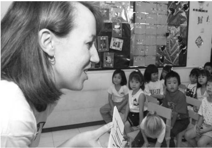
Sekolah Internasional seharusnya memiliki 'high level education'