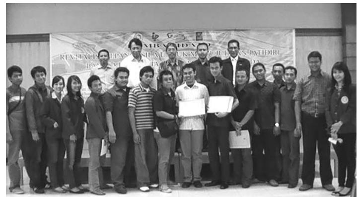
Bukti masih adanya anak muda yang tidak lengah dengan Pancasila!

Isi makalah yang dianggap berkualitas inilah yang penulisnya dipanggil untuk memberikan pidato. Hasilnya? Tidak mengecewakan. Ketujuh finalis membuat dewan juri dan pihak LP3 Jatim