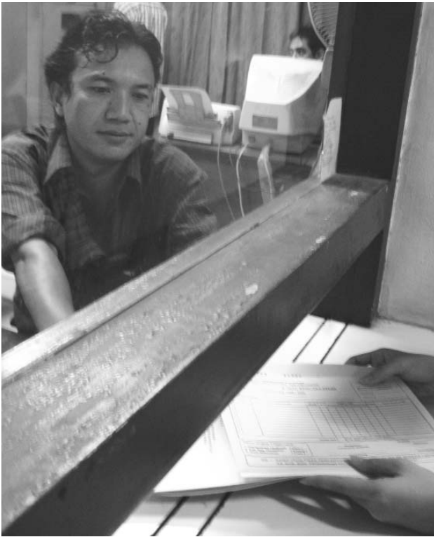
Pelayanan KRS yang masih manual