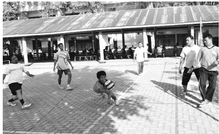
Voli Askring, membina kebersamaan Dosen dan Karyawan

Selain untuk mengolah kebugaran tubuh, latihan rutin tersebut juga ditujukan untuk membina ke-