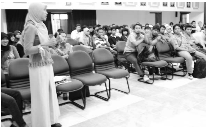
Mahasiswa turut mengapresiasi keterlibatan Prodi mereka dalam PHK-I tahun ini

Senin (27/7), bertempat di Ruang Garuda Mukti Gedung Rektorat Kampus C Unair, Dewan Pendidikan Tinggi DIKTI (Direktorat Jenderal Pendidikan Tinggi) mengadakan visitasi dalam rangka menindaklanjuti proposal Program Hibah Kompetisi berbasis Institusi (PHK-I) yang telah diajukan oleh lima Prodi dari Unair. Kelima Prodi tersebut meliputi Kesehatan Masyarakat, Biologi, Antropologi, Sosiologi, dan Komunikasi.