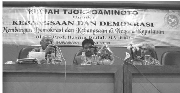
Kuliah Tjokro yang dihelat di Rektorat ITS