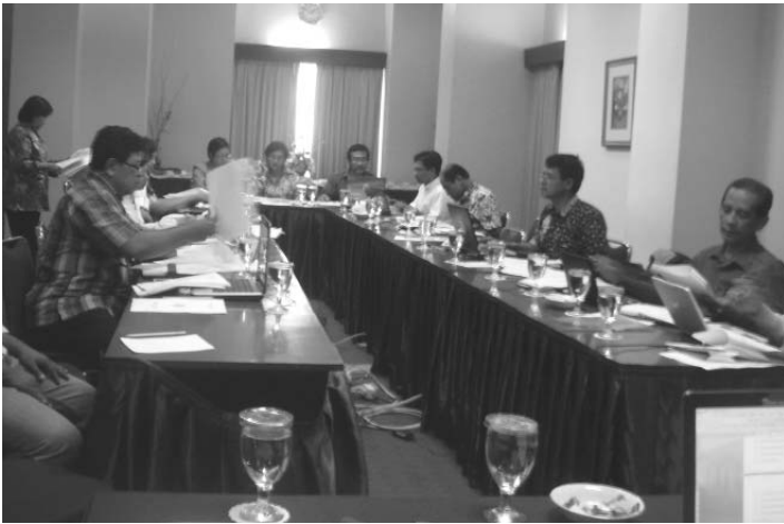
Suasana Raker Kurikulum di Hotel Bisanta Bidakara

Mencapai standar lulusan berkompentensi dan bermutu tinggi, tentunya harus diimbangi dengan pembenahan aspek-aspek yang membentuk lulusan itu sendiri. Perlu evaluasi untuk mengetahui bagian mana yang perlu dibenahi, kemudian menindaklanjuti hal tersebut secara aplikatif. FISIP Unair tentu saja menyadari akan hal itu.