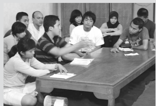
HIMA-BEM-Dekanat perlu rumuskan model MK yang terlembaga

bagi panitia dan peserta. MK juga merupakan media kegiatan bersama antara mahasiswa, HIMA, dan prodi. Oleh karena itu, dirinya berharap agar HIMA yang akan menyerahkan rencana kegiatan tersebut dapat mencantumkan tujuan yang jelas, indikator, ide sektor, dan hasil yang diharapkan.