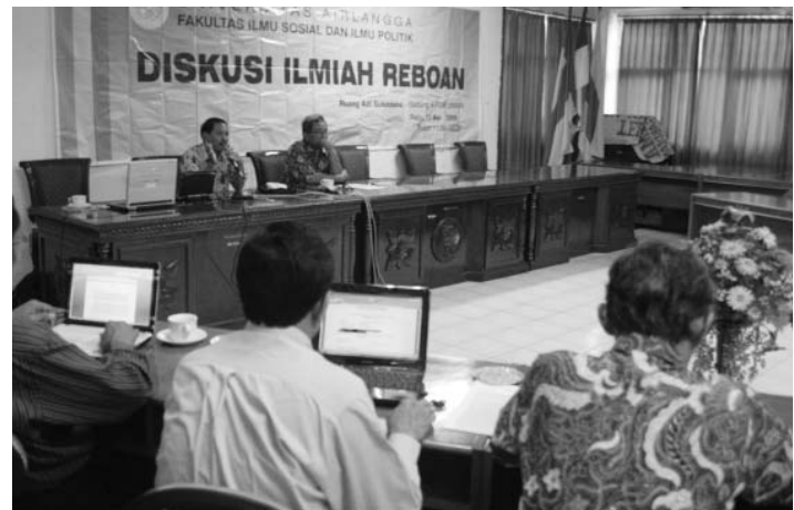
Diskusi Ilmiah Reboan minggu pertama Mei 2009

kongkrit yang patut pemerintah lakukan dalam membenahi masalah ini. Dengan begitu perlakuan Polri terhadap masyarakat sebagai mitra sejajar dapat terwujud dan usaha sistem keamanan dan ketertiban yang dicita-citakan bersama dapat berjalan sesuai harapan” ujar Bambang mengakhiri Diskusi Reboan siang itu. (zaq/rfa)