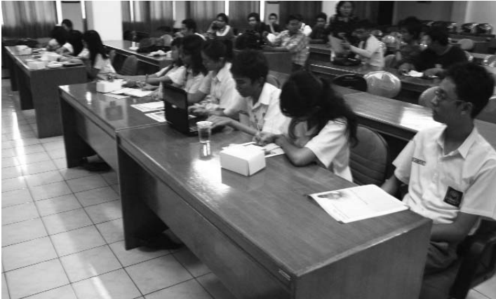
Siswa SMA 5 Surabaya

S enin (4/5), bertempat di ruang Adi Sukadana Gedung A FISIP Unair, sepuluh siswa kelas XI dari SMA Negeri 5 Surabaya (Smalabaya) melakukan kunjungan ke Departemen Hubungan Internasional (HI). Mereka datang dalam rangka Student Day yang menjadi salah satu program rutin tahunan bagi siswa kelas X dan XI di Smalabaya.