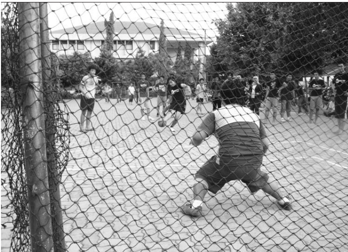
Futsal, pertandingan paling ramai HI Cup 2009

Iringan musik mengalun dari lapangan parkir mobil dosen FISIP Unair. Canda tawa dan sorak sorai meramaikan segenap penjuru lapangan. Malam itu, tepat di awal bulan Mei, Departemen Hubungan Internasional Unair punya gawe bertajuk Hlkustik 2009. Program tahunan Divisi Minat dan Bakat Himpunan Mahasiswa (Hima) HI ini digelar sebagai malam penghargaan sekaligus penutup rangkaian kegiatan HI Cup 2009, even olahraga yang digelar selama dua minggu pada awal sampai pertengahan April.