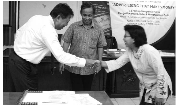
Usai penandatanganan MoU