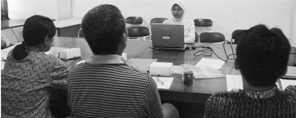
Seleksi tingkat FISIP peserta Mawapres 2009

Setiap mahasiswa memiliki potensi masing-masing. Ada yang berprestasi dalam bidang akademik saja dan pasif di bidang non-akademik, ada pula yang sebaliknya. Yang sulit tentu menyeimbangkan keduanya; berprestasi di bidang akademik maupun non-akademik.