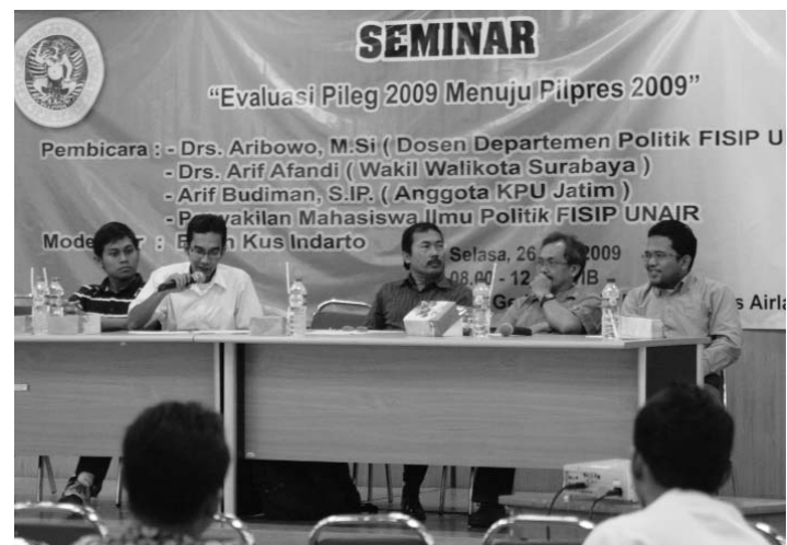
Seminar yang diadakan di gedung C

Natur-E Journey to Beauty: Stay Young Naturally